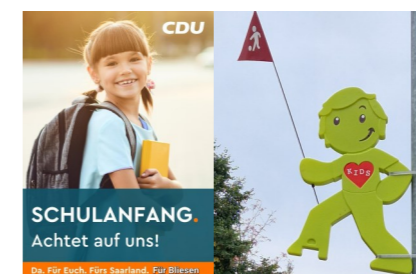
Sicher für Kinder Plakate bitten Autofahrer um Rücksicht auf Kinder, sog. Street-Buddys hängen im Augenborn und der Burgstraße