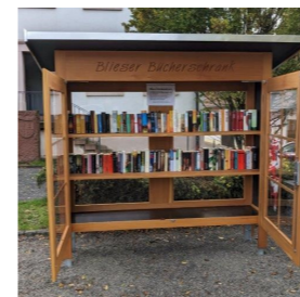
Bücherschrank am Haus Gillen erfreut sich großer Beliebtheit